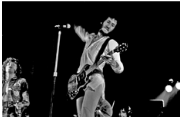
Ffynhonnell 8: The Who

Gwnaeth The Kinks ryddhau eu cân gyntaf ' Long Tall Sally ' 26 yn 1964, a'u halbwm cyntaf o'r enw Kinks yr un flwyddyn. Daeth Ray Davies yn enwog am ei ddefnydd arloesol o synau yn y stiwdio. Er enghraifft, torrodd amp ei gitâr er mwyn ystumio'r ( distort ) sain ar ' You Really Got Me ', 27 a wnaeth ddylanwadu ar lawer o gerddorion garej amaturaidd yn y DU ac yn UDA. The Kinks hefyd oedd y cerddorion cyntaf o Brydain i ymgorffori'r drôn Indiaidd yn eu cerddoriaeth, fel sydd i'w glywed yn ' See My Friends '. 28 Yn y pen draw, bydden nhw'n symud oddi wrth wneud senglau i ganolbwyntio ar ysgrifennu albymau thema am elfennau o fywyd ym Mhrydain fel The Kinks Are The Village Green Preservation Society (1968). Yn ystod eu taith o amgylch America yn 1965, cafodd y band eu gwahardd rhag canu yn UDA am bedair blynedd gan un o undebau cerddorion America.