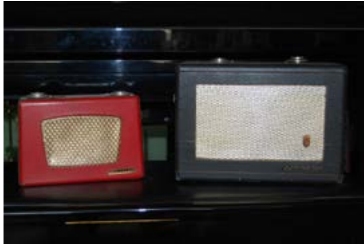
Ffynhonnell 4: Radio transistor cynnar a oedd ar gael yn y DU yn 1956

Roedd newidiadau ym maes darlledu ar y radio hefyd. Hyd at yr 1970au, roedd gan y BBC fonopoli ar ddarlledu radio yn y DU. Roedd rhaglenni'r BBC yn gyfyngedig iawn o ran y gerddoriaeth roedden nhw'n gallu ei chwarae, ac nid oedd llawer o amser ar yr awyr yn cael ei roi i artistiaid newydd, yn enwedig y rheini a oedd yn gysylltiedig â chynulleidfaoedd yn eu harddegau. Dim ond Pick of the Pops oedd yn chwarae'r gerddoriaeth hon unwaith yr wythnos.