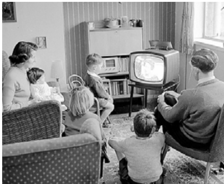
Ffynhonnell 10: Teulu ym Mhrydain yn gwyllo'r teledu yn yr 1950au