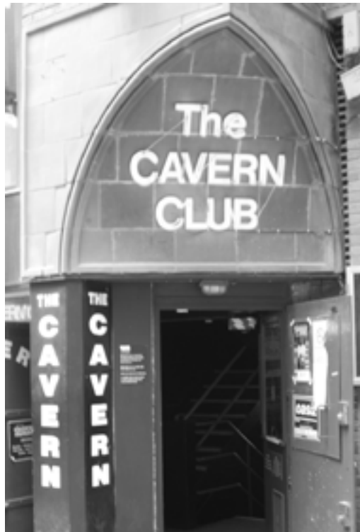
Ffynhonnell 5: The Cavern Club