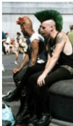
Ffynhonnell 13: Dau bync yn Llundain

Nid yw'n llawer o hwyl bod yn ifanc heddiw... Mae 104,000 o blant ifanc sydd wedi gadael yr ysgol wedi mynd yn syth o'r ystafell ddosbarth i fywyd diog a dibwrpas ar y dŵl... A oes syndod bod pobl ifanc yn teimlo eu bod wedi'u dadrithio a'u bradychu? A oes syndod eu bod yn troi at arwyr anarchaidd fel Johnny Rotten?... Mae pync roc wedi'i deilwra ar gyfer pobl ifanc sy'n meddwl mai dyfodol pync sydd o'u blaenau.