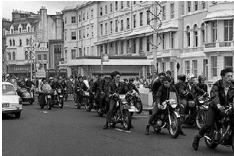
Ffynhonnell 12: Rocwyr yn y 1960au 78

Fe wnaeth y Rhai Gwyllt [gangiau o mods a rocwyr] wthio eu ffordd i dref glan y môr [Clacton] ddoe – 1,000 o bobl ifanc yn eu harddegau yn ymladd, yn yfed, yn bloeddio ac yn creu helynt ar sgwteri a beiciau modur... Roedd bechgyn a merched ifanc mewn siacedi lledr yn ymosod ar bobl yn y stryd, yn troi ceir a oedd wedi parcio drosodd, yn torri i mewn i gabanau ar y traeth, yn torri ffenestri ac yn ymladd â gangiau cystadleuol. 77