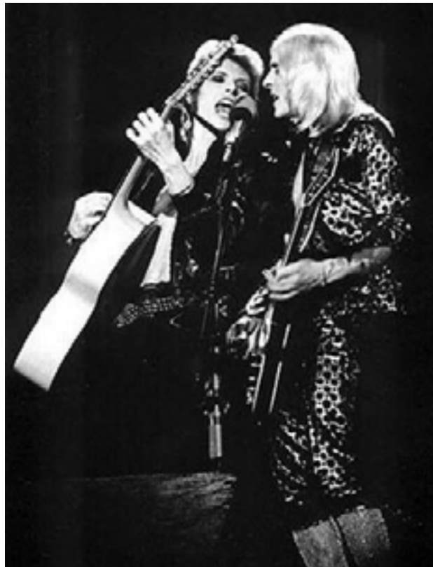
Ffynhonnell 9: David Bowie a Mick Ronson yn perfformio

Roedd David Bowie wedi treulio wyth mlynedd yn ceisio dod yn enwog, a ' Space Oddity ' 40 (1969) oedd ei unig lwyddiant. Yn 1972, gwnaeth un o'i greadigaethau artistig, sef Ziggy Stardust â'i wallt coch pigog, daro tant â'r cyhoedd ar ôl perfformiad trawiadol o'r gân ' Starman ' 41 ar Top of the Pops , yn gwisgo siwt undarn secwinau ac esgidiau plattform, gyda'i fraich dros ysgwydd ei gitarydd Mick Ronson. Arhosodd yr albwm The Rise and Fall of Ziggy Stardust and the Spiders From Mars (1972) yn siart y 50 Uchaf am ddwy flynedd, er nad aeth yn uwch na rhif 5.