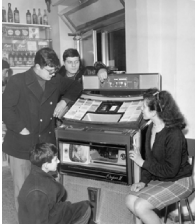
Ffynhonnell 3: Pobl ifanc yn eu harddegau yn gwranddo ar y jiwcbocs