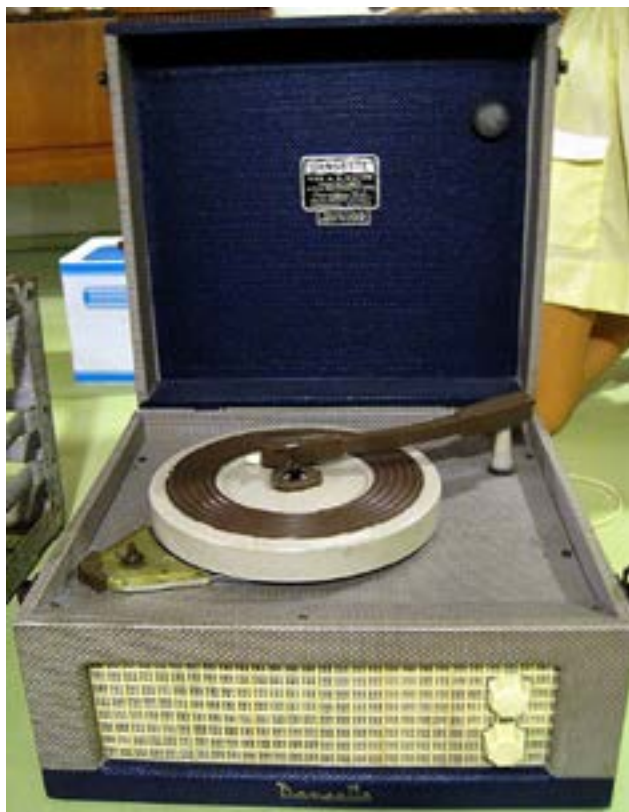
Ffynhonnell 2: Chwaraewr recordiau Dansette

gyntaf. Roedden nhw i'w canfod yn aml mewn mannau lle'r oedd pobl yn eu harddegau yn treulio eu hamser hamdden, e.e. y nifer cynyddol o fariau coffi fel El Toro yn Muswell Hill, neu'r Kardomah yn Lerpwl.