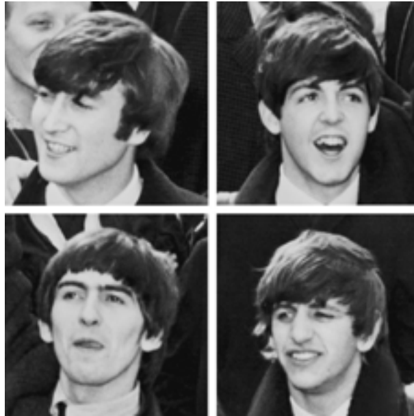
Ffynhonnell 7: The Beatles yn Llundain yn 1964

Roedd The Beatles wedi bod yn canu gyda'i gilydd ar ryw ffurf ers 1956, ond dim ond ar ôl i Brian Epstein eu gweld yn canu yn The Cavern Club yn Lerpwl yn 1961 y daethon nhw'n enwog. Cafodd delwedd rocwyr y grŵp ei newid wrth i Epstein eu rhoi mewn siwtiau hamdden heb goleri yn lle siacedi a throwsus lledr, a thorri eu gwalltiau'n fyrrach mewn steil 'pennau mop' ( mop tops ). Dysgodd Epstein nhw i ymddwyn mewn ffordd a fyddai'n dderbyniol i'r gynulleidfa ehangaf bosibl (e.e. ymgrymu ar ôl pob cân) a dweud wrthyn nhw am gadw eu perfformiadau'n fyr er mwyn gwneud yn siŵr bod y gynulleidfa eisiau mwy bob tro.