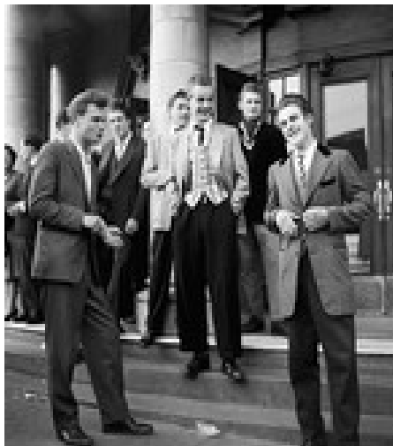
Ffynhonnell 11: Tedi bois yn yr 1950au

Fodd bynnag, nid oedd mwy o amser hamdden a mwy o arian yn gwneud pobl ifanc yn hapus, o anghenraid. Gallai olygu llawer mwy o amser heb ddim byd adeiladol i'w wneud a mwy o ddiflastod.