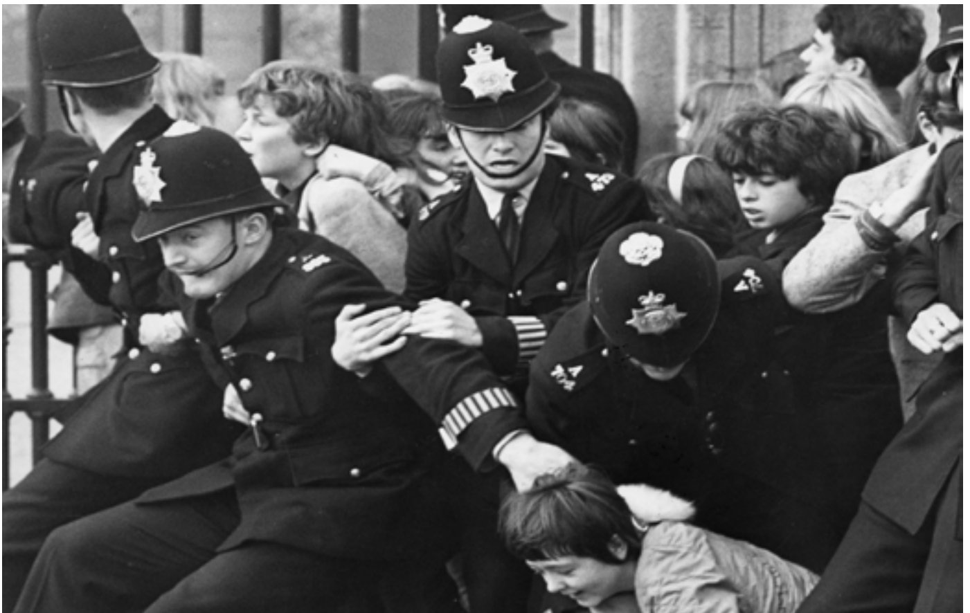
Ffynhonnell 1: Cefnogwyr y tu allan i Balas Buckingham wrth i The Beatles dderbyn eu gwobrau MBE yn 1965